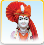
પૂર્ણ પુરંદરભાઈ ભગવાન સ્વામિનારાયણ