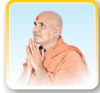
દિવ્ય પ્રેરક ગુરુવર્ચ પ.પૂ. સ્વામીશ્રી