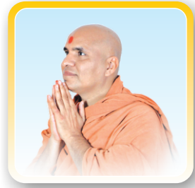
દિવ્ય પ્રેરક ગુરુવર્ધ પ.પૂ. સ્વામીશ્રી