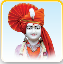
પૂર્ણ પુરુષોત્તમ ભગવાન સ્વામિનારાયણ