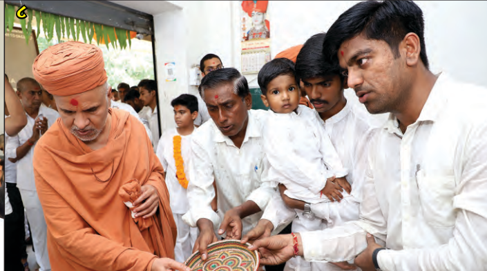
(૧-૬) વિસનગર, ઊંઝા, વિજાપુર, સ્વા. ધામ, વાસાણા, વસ્ત્રાલ ખાતે અનુક્રમે ગુરુજીની પદરામણીનો લાભ (૭-૮) નરોડા ખાતે સત્સંગ સભા તથા પદરામણીમાં ગુરુજીનો લાભ