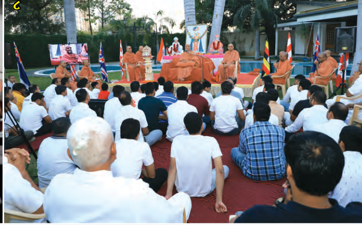
(૧-૪) હિંમતનગર ઝોન ખાતે અનુક્રમે શિબિર તથા પદ્ધરામણીમાં લાભ (૫-૭) વડોદરા, ઘનશ્યામનગર, સ્વામિનારાયણ ધામ ખાતે અનુક્રમે ઝોળીસેવામાં લાભ (૮) વિદેશના મુક્તોને લાભ આપતા વ્હાલા ગુરુજી