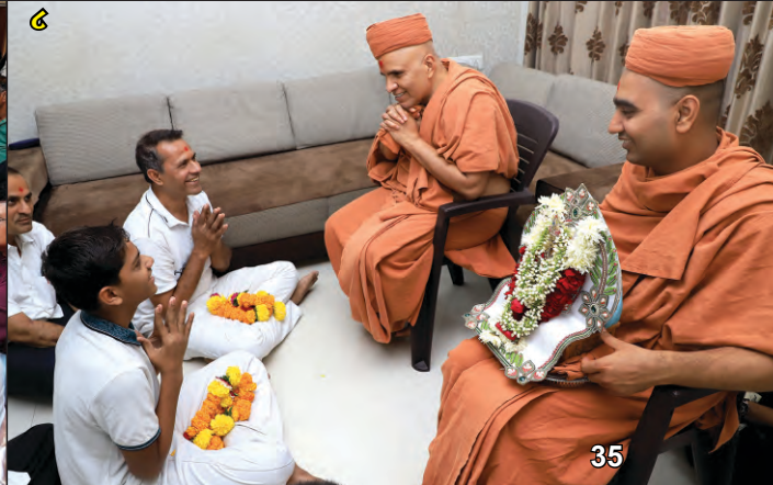
(૧-૮) વસ્ત્રાલ-ધસનપુર તથા ગોતા-ઘાટલોડિયા ખાતે અનુક્રમે શિબિર તથા પધરામણીમાં લાભ