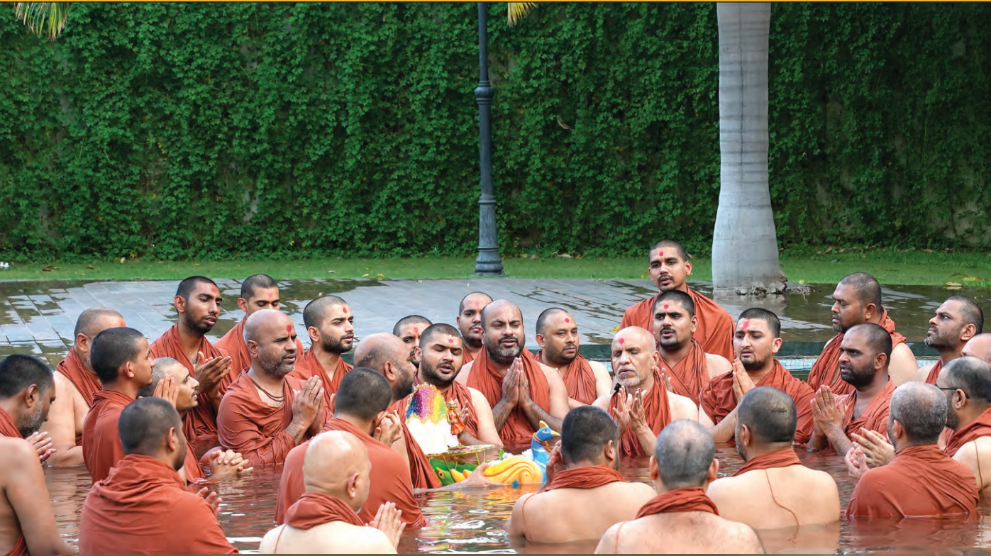
દિવ્ય સંત શિબિર : ૨૦૨૪