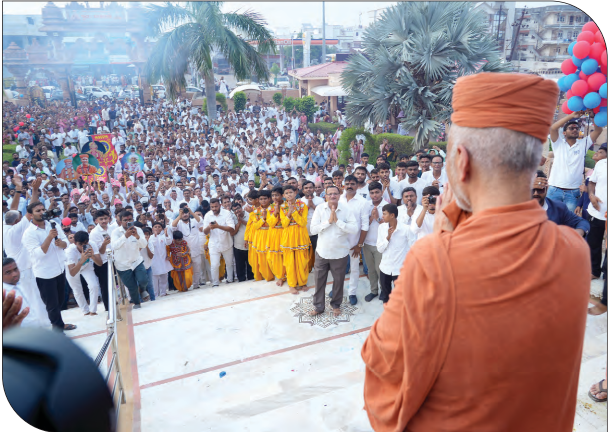
જેનાં દર્શન માત્રે કલ્યાણના કોલ મળી જાય એ સ્વરૂપ એટલે વ્હાલા ગુરુજી.