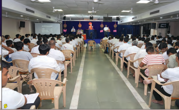
(૧-૨) ગુરુકુલના વિદ્યાર્થીઓને તથા શાહીબાગ ખાતે અનુક્રમે સભા તેમજ પધરામણીમાં લાભ આપતા ગુરુજી (૩-૪) SKS કંપ તથા વિશ્વ યોગ દિવસની ઉજવણી (૫-૬) સંપર્ક સંચાલક શિબિર તથા બાળ સંચાલક તાલીમ (૭-૮) આંતરરાષ્ટ્રીય માતૃ-પિતૃ વંદના દિનની હોંશમેર ઉજવણી